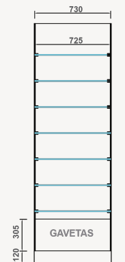
Refª ON.MF.V.1G (Gaveta)