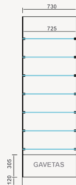
Refª ON.MF.V.1G (Gaveta)