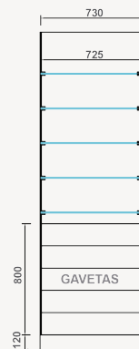
Refª ON.MF.V.5G (Gavetas)